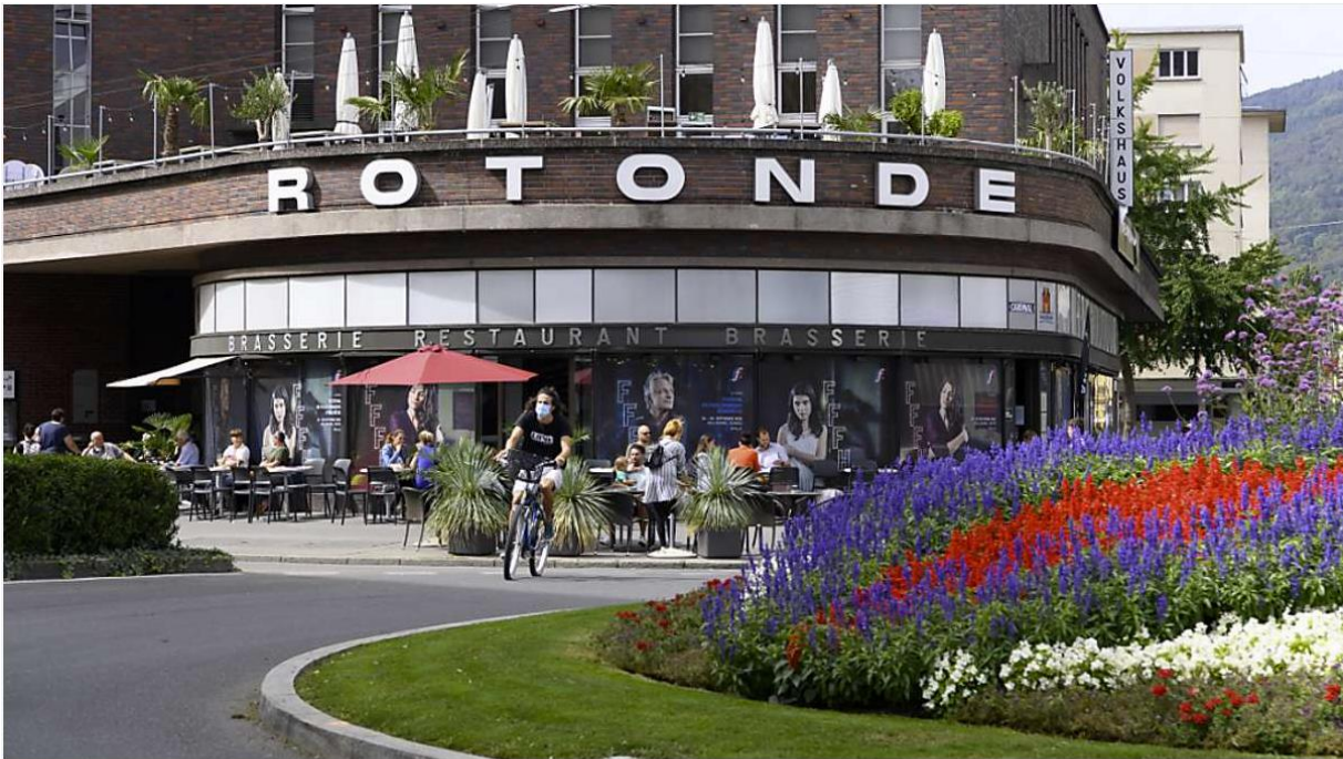
La première séance de réseautage des tandems linguistiques se déroulera autour d'un apéro au bar de la Rotonde à Bienne (archives).