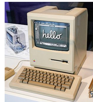
Le Macintosh d'Apple a révolutionné l'informatique.