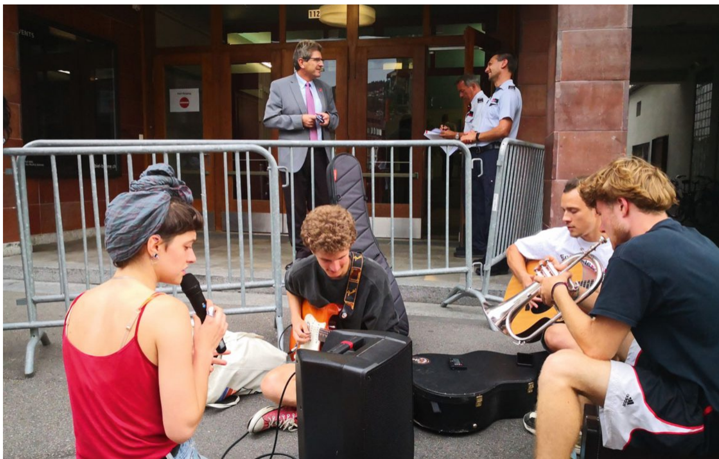
Des membres du CAJ et du X-Project ont accueilli les parlementaires à la Maison du peuple pour demander plus d'espace pour leurs activités.

En effet, le X-Project est censé déménager de la rue d'Aarberg 72 au chemin de la Course 62 en octobre. Le centre de jeunesse souhaiterait toutefois pouvoir conserver son emplacement derrière la gare et utiliser les deux bâtiments afin d'étendre ses activités. De son côté, le CAJ voit arriver la rénovation imminente de la Coupole. Suite aux travaux, le centre autonome perdra 100 m 2 par rapport à son ancienne superficie. Il demande ainsi de pouvoir conserver la Villa Fantaisie, qui abrite actuellement plusieurs associations en lien avec le Centre autonome de jeunesse. «Nous souhaitons pouvoir profiter de cet endroit au moins jusqu'à ce qu'un investisseur se montre intéressé», partage un des activistes du CAJ tout en abordant différents politiciens pour sa pétition. Samuel Kunz estime que, pour l'instant, quelque 2600 signatures ont été récoltées. «Ce soir, nous avons entamé des discussions avec des membres de partis de droite.