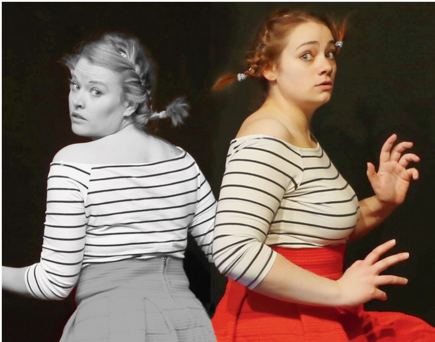
«La fille, le fantôme et le fer à bricelets» sera joué dès le 26 octobre, en français et en allemand, au Rennweg 26.