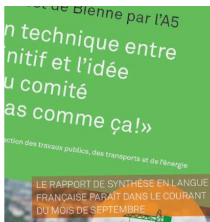
Le rapport en français sera disponible dès demain à midi. CAPTURE D'ÉCRAN

La TEE considère, elle, avoir traité équitablement les deux communautés, puisque «les informations essentielles sont disponibles dans les deux langues» au travers du résumé du rapport et d'un communiqué de presse en français. Elle justifie la publication ultérieure du rapport complet en français par un travail de traduction qui «nécessite quelques jours pour garantir la même exactitude que le document original». Mais pourquoi ne pas avoir attendu que la version francophone soit prête pour pouvoir sortir le document dans les deux langues en même temps? «Le rapport a été validé en séance du Conseil exécutif du