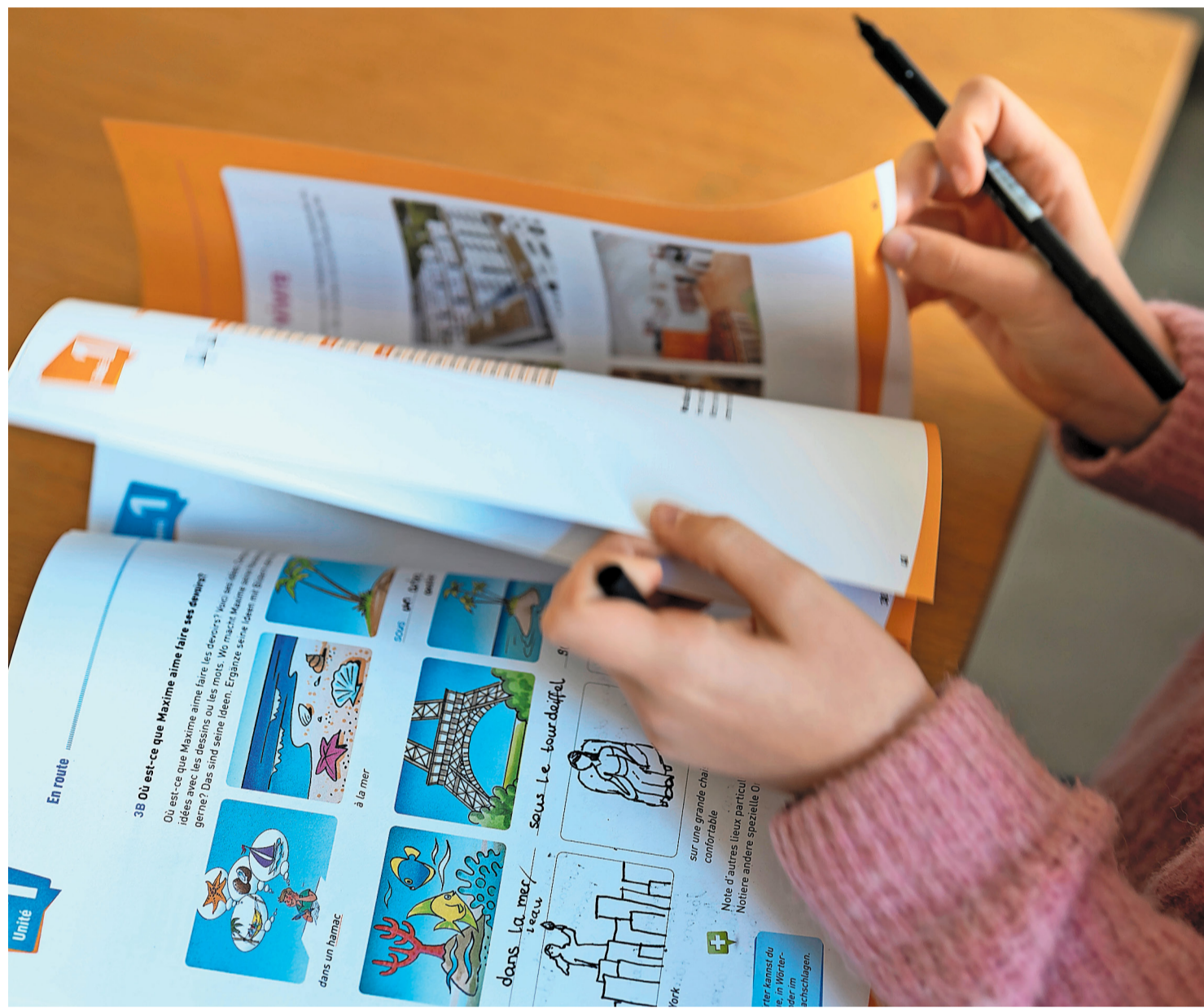
Französisch-Unterricht soll es in der Ostschweiz künftig erst ab der Oberstufe geben.

Daraufhin schaltete sich der damalige Vorsteher des Eidgenössischen Departements des Innern, Bundesrat Alain Berset (SP), in die Diskussionen ein. Er äusserte sich klar ablehnend zu den Plänen. Unter grossem politischem Druck