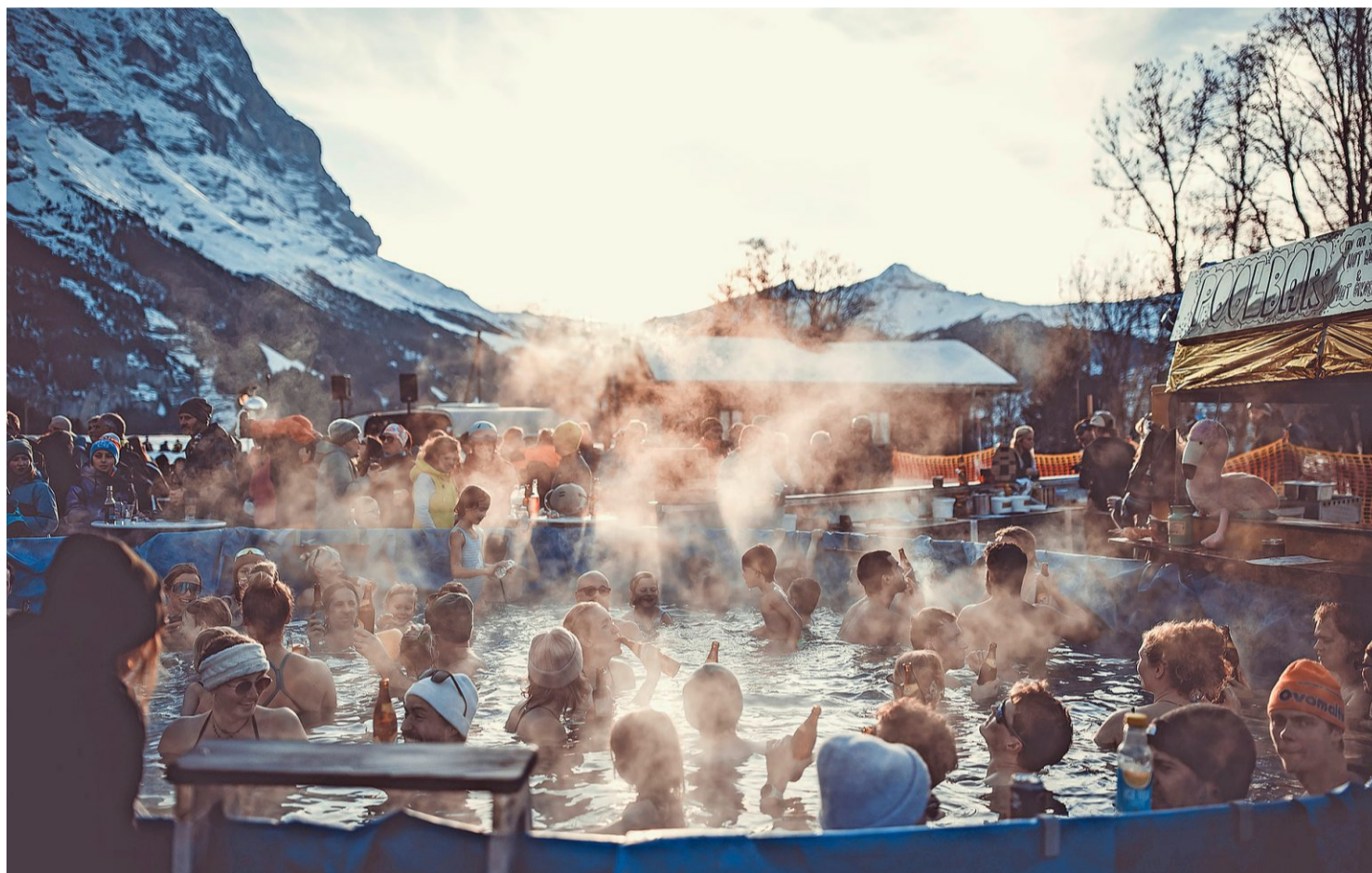
Bei der Bus Stop Bar in Grindelwald: «Grindelwald les bains» mit Pool und 38 Grad heissem Wasser.

Deshalb seien im vergangenen Monat folgende Auflagen gemacht worden: Der Betreiber muss die Zustimmung einer klaren Mehrheit der Anwohnerinnen und Anwohner sicherstellen und eine funktionierende, verträgliche Transportlösung gewährleisten.